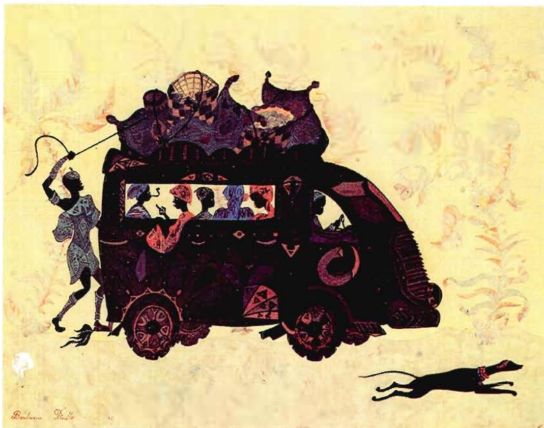
Figure 2 Car rapide Boubacar Diallo