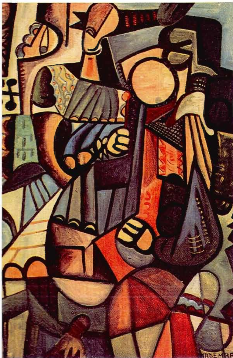
Figure 9 Les musiciens Mademba Guèye