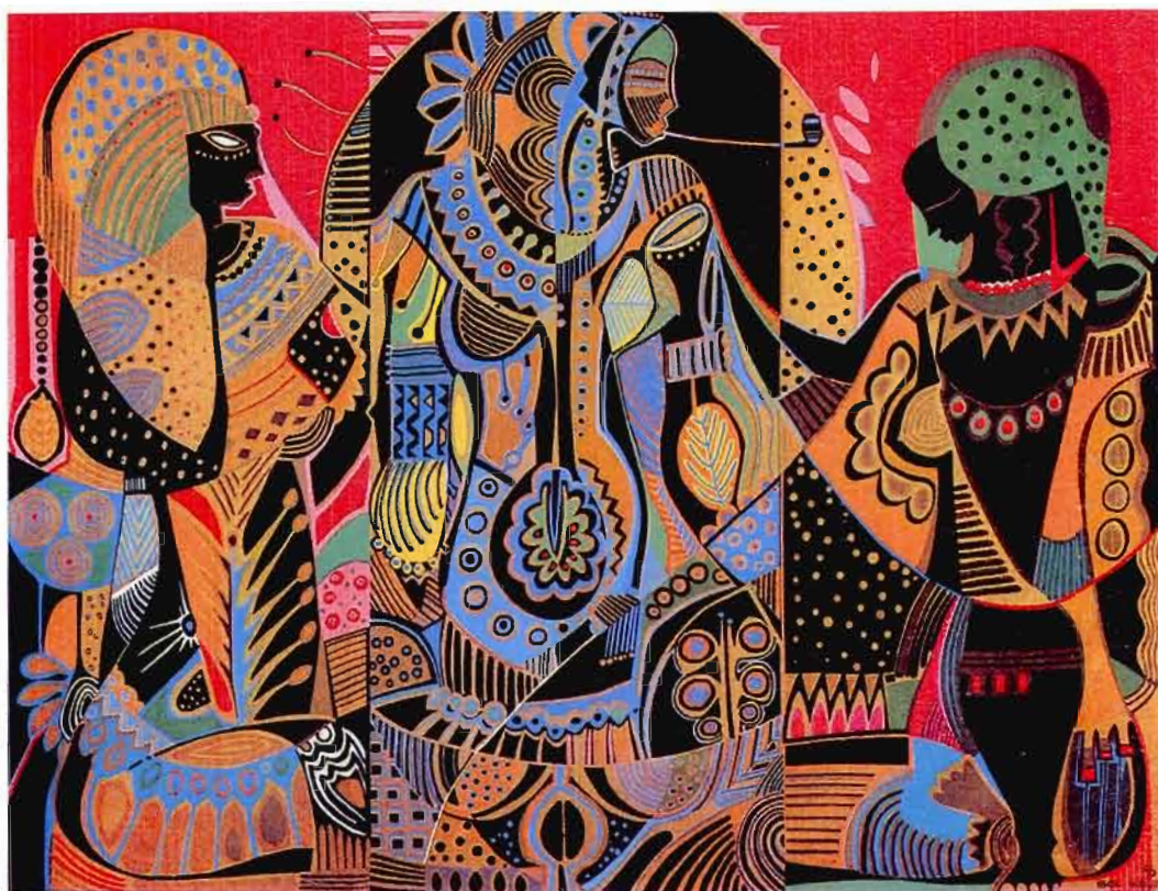
Figure 5 Les trois épouses Ibou Diouf