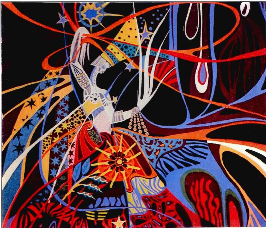
Figure 13 La semeuse d'étoiles Papa Ibra Tall