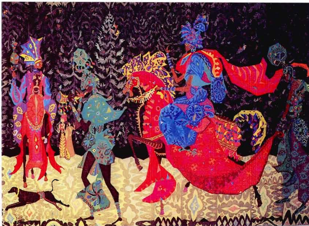
Figure 3 Cortège royal Boubacar Diallo