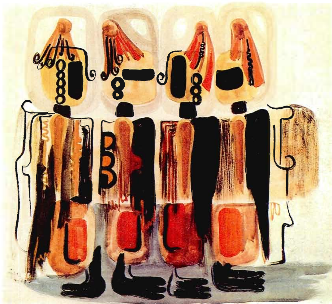
Figure 10 Procession Souleymane Keita