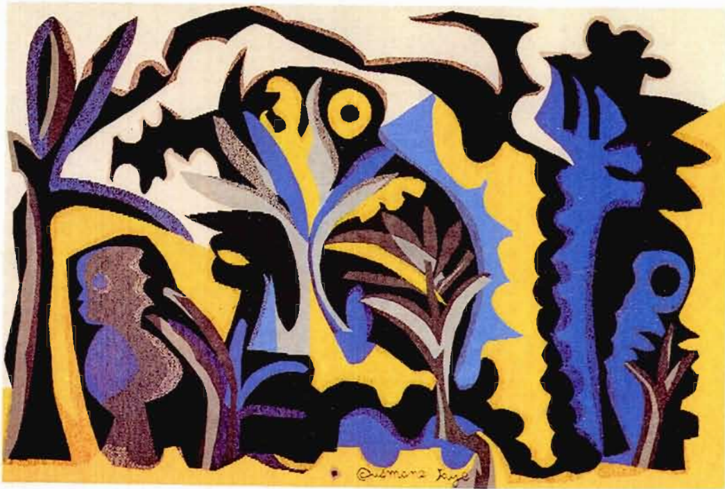
Figure 8 La forêt Ousmane Faye