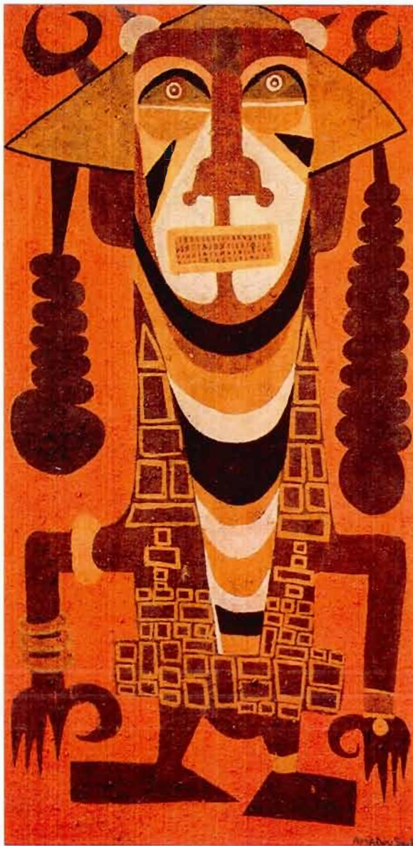
Figure 12 Samba Guéladio Amadou Seck