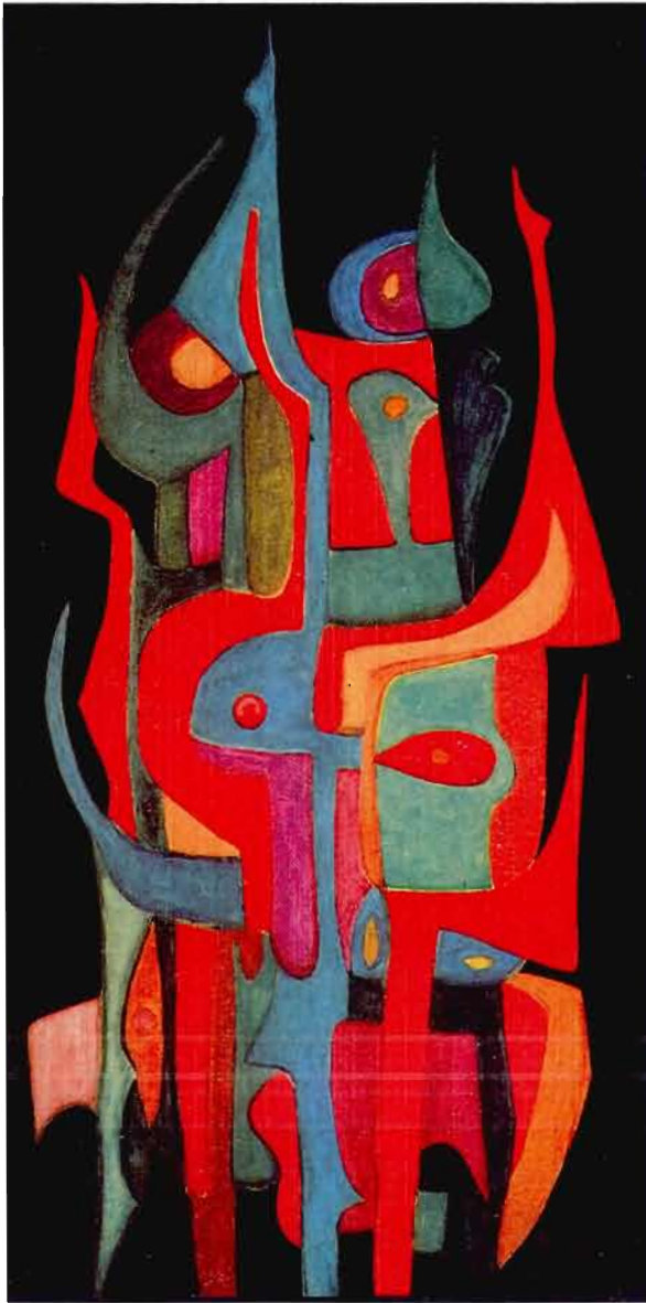
Figure 7 L'heure des esprits Théo Diouf