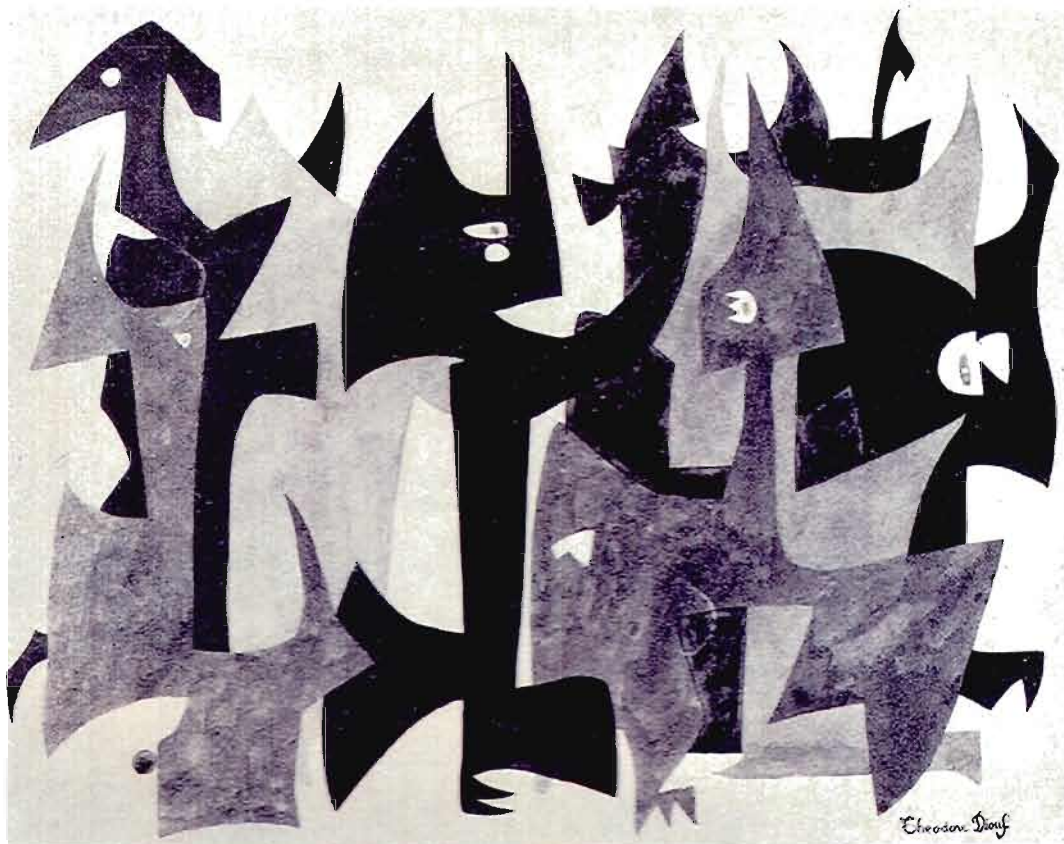
Figure 6 Conseil des sages Théo Diouf