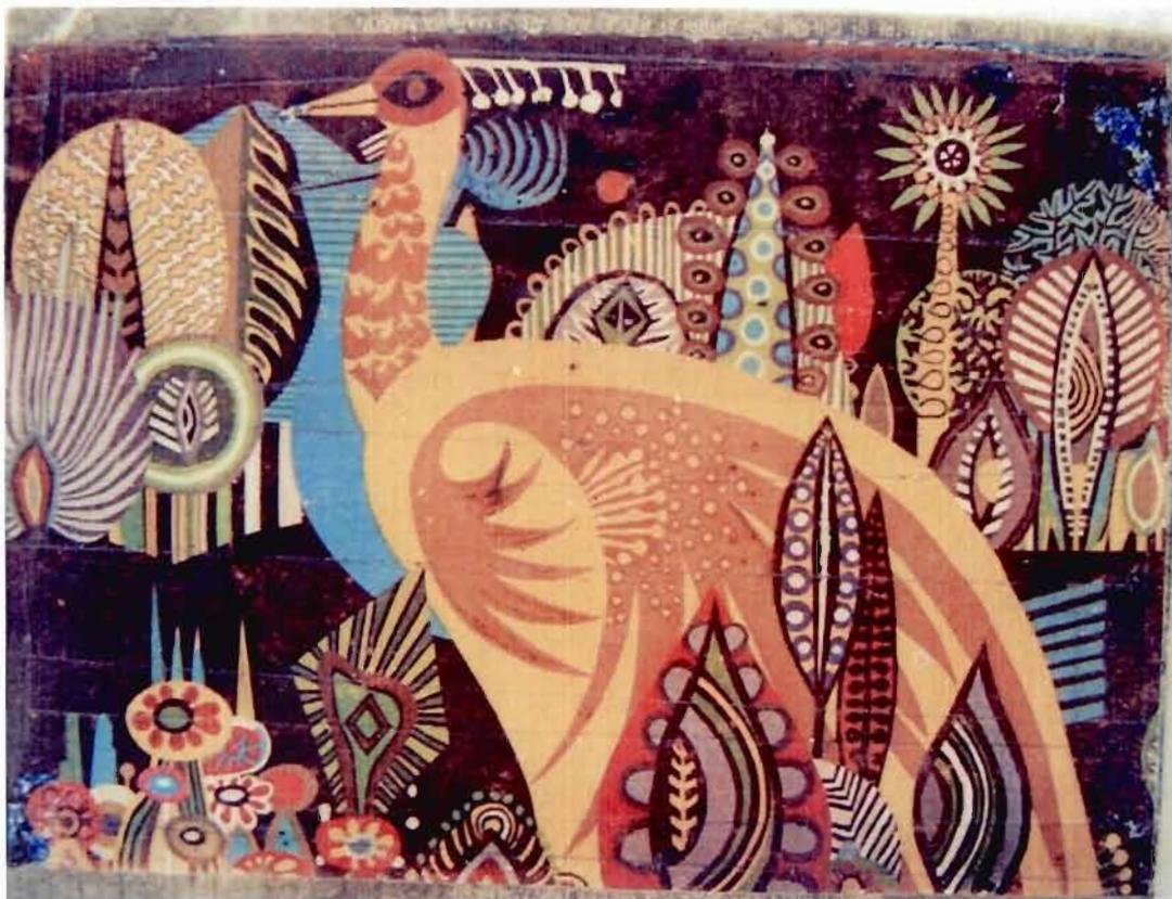
Figure 11 L'oiseau du songe Modou Niang